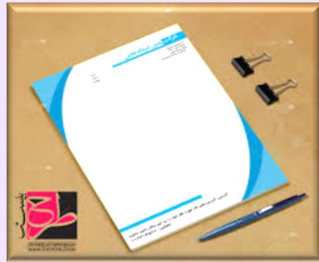
نام دوره: کارور Photoshop

کد استاندارد مهارتی و آموزشی: ۱۰۶۷۶۳۰۰۳۷۲۳۳۳۷